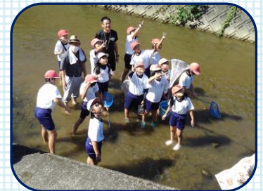
ドローンで記念撮影