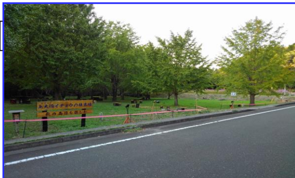
今は、紅葉が始まった段階です。