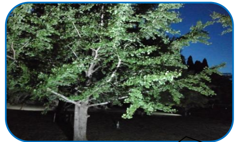
ライトアップ 銀杏

身近にある、すばらしい大自然を秋の夜の明るさで再確認してみませんか!! 上大迫自治会館前の広場では、イチョウ林のライトアップが11月30日まで行われています。 なお点灯時間は夕方 6時から10時です。 是非、幻想的なイチョウの杜の素晴らしさを夜、昼に限らず見学に行ってください。