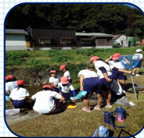
子ども達が川の中へ