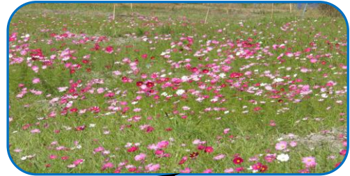
県道340号線の松岡・都合付近

陽成の外から、内から、大人や子供たちが来て水田を中心の地域資源を改めて見て、地域の営みを知り環境の良さを知って頂ければありがたいと思っています。