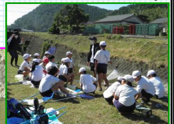
子ども達が川の中へ