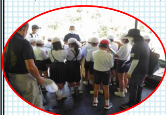
説明を熱心に聞いていました。