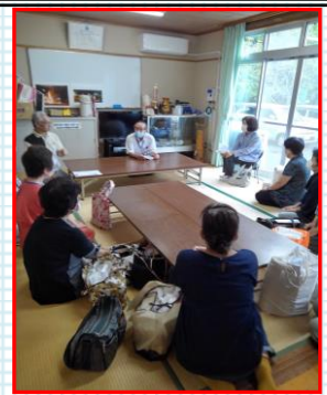
出発式の様子です