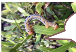
幼虫 シャクトリムシ

成虫は、全体的に濃い紺色で、羽に黄色の線がある蛾で、昼間飛び回ります。コミセン周辺でも見かけています。幼虫が大量発生しているときは、薬剤散布が効果的です。