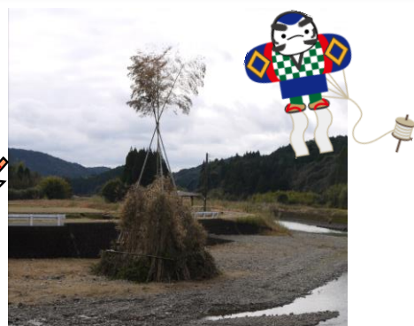
12月23日(火)、立派なやぐらができました!