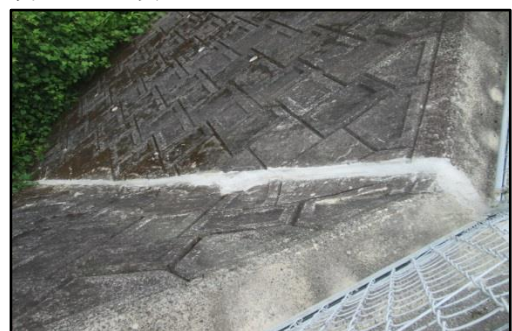
駐車場のひび割れを補修してもらいました