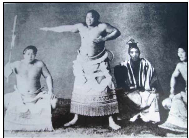
今回の調査で「横綱西ノ海」の写真を得ました