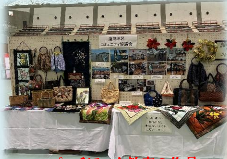
パッチワーク教室の作品