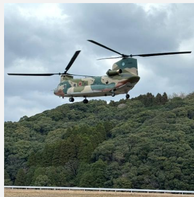
ヘリコプターで住民避難