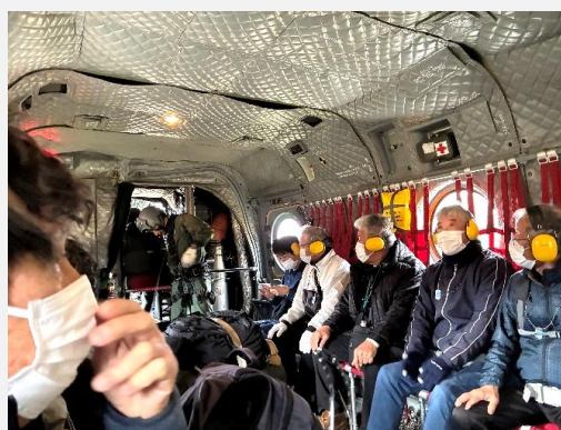
大型ヘリコプターの内部