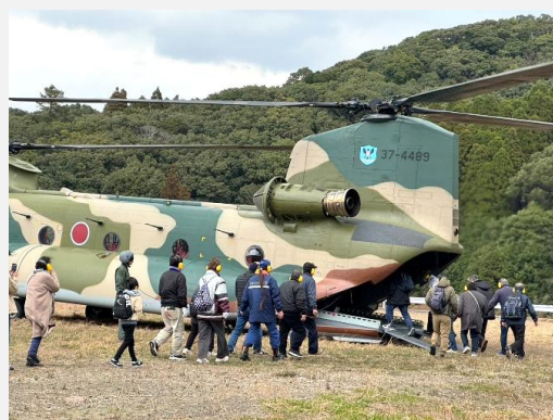
大型ヘリコプターへ搭乗