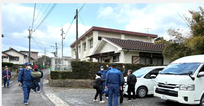
車で未来ゾーンへ移動