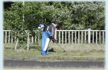
男性陣はパワーでグイグイ