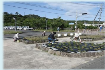
女性陣は一本一本丁寧に