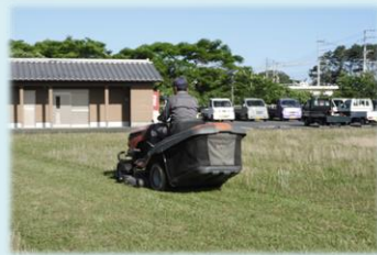
乗用草刈り機でスイスイ