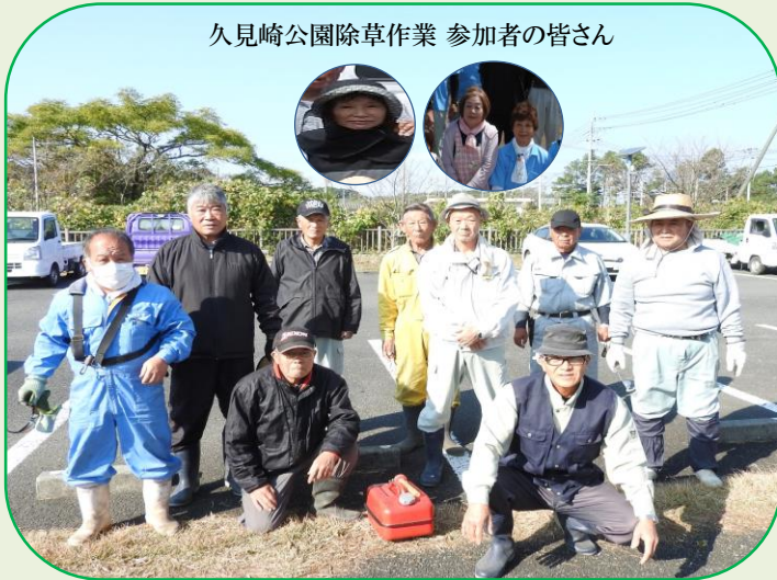
久見崎公園除草作業 参加者の皆さん

令和5年11月26日(日)、久見崎公園の除草作業(4回目)を実施しました。当日は風の強い肌寒い日でしたが、12名の方に参加していただきました。広い公園内を約3時間かけての除草作業になりました。