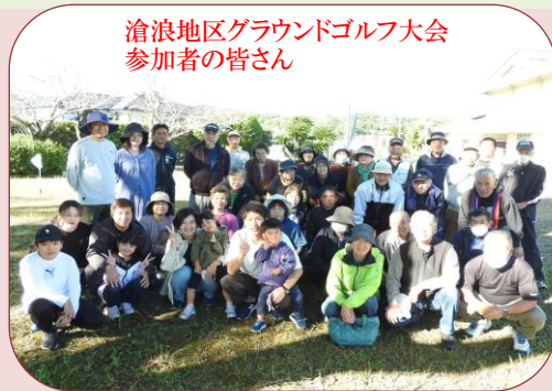
滄浪地区グラウンドゴルフ大会 参加者の皆さん

令和5年10月29日、旧滄浪小学校において、滄浪地区グラウンドゴルフ大会を行いました。当日は晴天に恵まれ、子供たちも交えてグラウンドゴルフを楽しまれました。あちこちでホールインワンもたくさん出て、大歓声があがっていました。参加者の皆さんは、秋のスポーツを満喫した一日になりました。