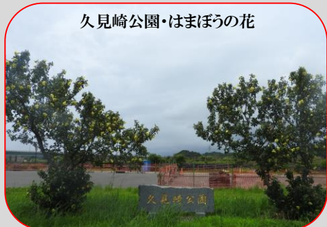
久見崎公園・はまぼうの花