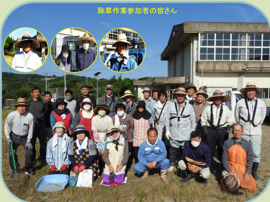
除草作業参加者の皆さん

令和5年6月4日、旧滄浪小学校の除草作業を行いました。当日は天気にも恵まれ、30名の皆さんが汗だくになりながらの除草作業になりました。男性の皆さんは、広い学校回りを隅々まで草刈り機を使っての除草作業、女性の皆さんは、花壇回りや記念碑回りなど手作業できれいになりました。