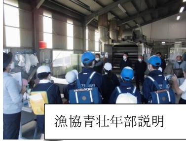
漁協青壮年部説明