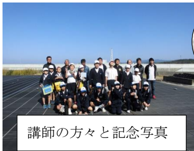
講師の方々と記念写真