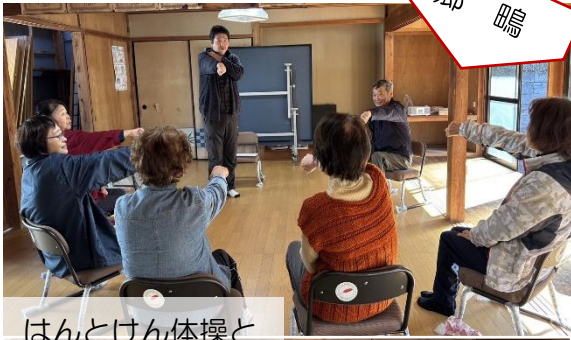
はんとけん体操と