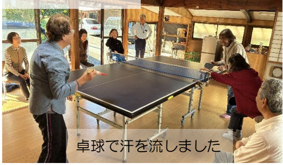
卓球で汗を流しました