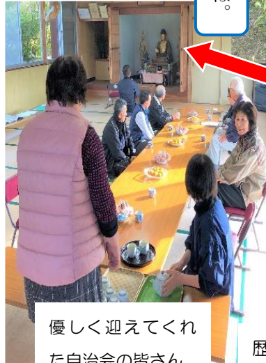
優しく迎えてくれた自治会の皆さん