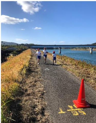
峰山小持久走大会 12/7

11/26 今年も未来学校クリスマスマルシェに参加させていただきました。よき天候でたくさんの方が買い物を楽しんでおられました。来場いただいた皆さん、参加いただいた各店舗の皆さん、ありがとうございました。5月にもこのようなイベントがあるようです。また、よろしくお祈りします。