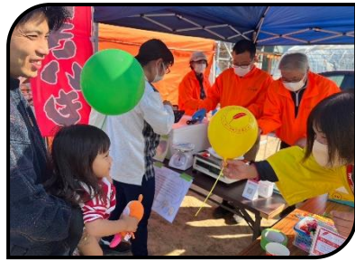
赤い羽根共同募金にも協力