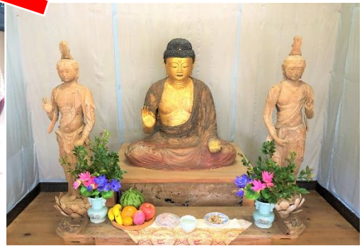
歴史的な文化財に触れ、心が洗浄されました。1週間は広い心で穏やかに生活できました。