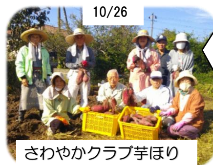
さわやかクラブ芋ほり