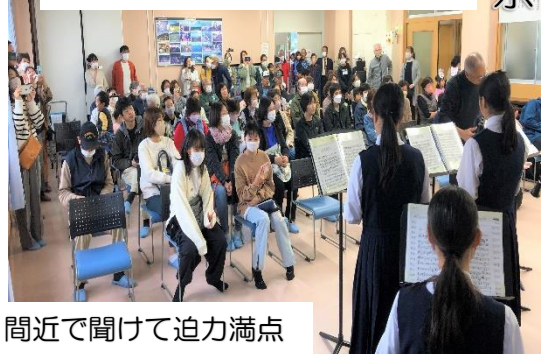
間近で聞けて迫力満点