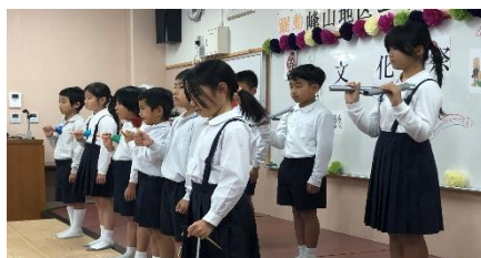
峰山小 2.3.4 年生緊張の歌、演奏

11/26 長崎自治会館 阿弥陀堂祭り 年2回行われている祭りの第2弾! 9時~10時半まで開放! お待ちしています。