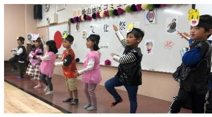
こども園そう組かわいいお遊戯