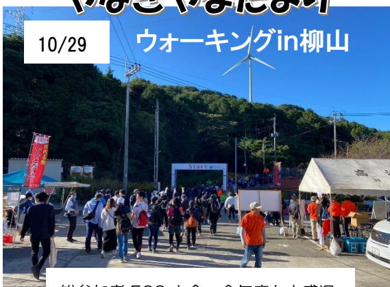
総参加者 500 人余 今年度も大盛況