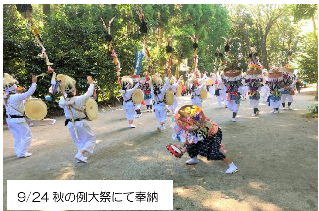
9/24 秋の例大祭にて奉納