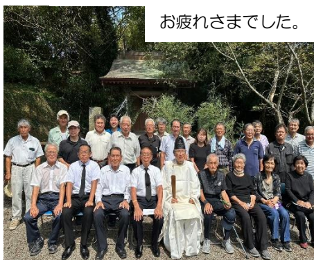
お疲れさまでした。

三十名弱が集まり、開催されました。今回は前回より多くの遺族の方々の御参列をいただきました。朝方降雨が、その後の好天のため、護国神社内は蒸し風呂状態。準備が整うまで、鳥居や飾り付けた榊などの少ない日陰で暑さをしのがないと、汗でせつかくの衣装がびしょびしょに。来年は一時間早めて開催することになりました。