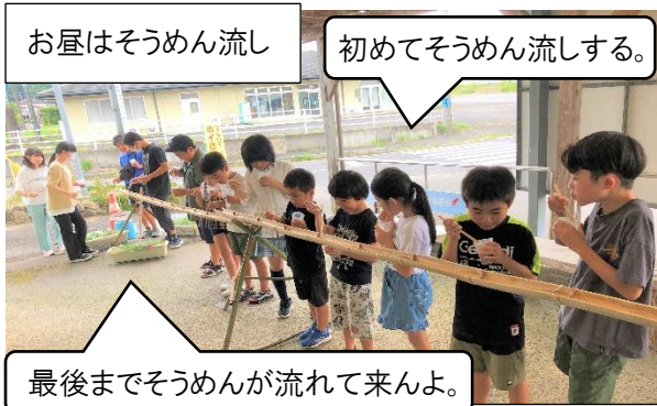
お昼はそうめん流し