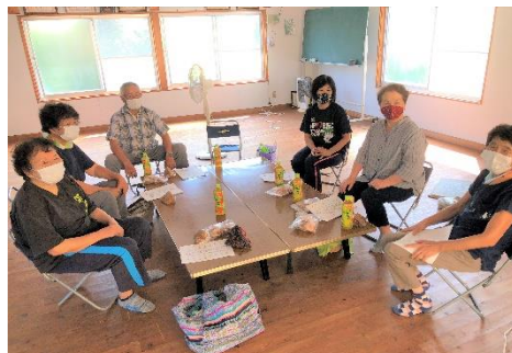
上自治会サロンにお邪魔

笑顔はじける敬老会。昼食はオリジナルお好み焼き。久しぶりの会食でした。ただ、エアコンがないため、長居をすることができませんでした。