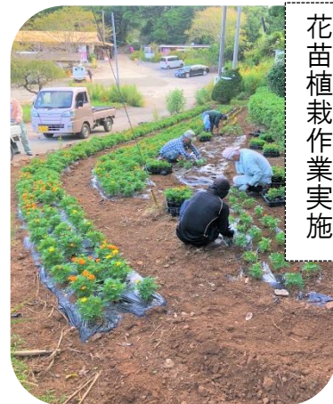
花苗植栽作業実施