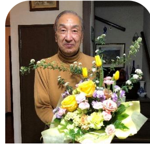
勇退された木元会長