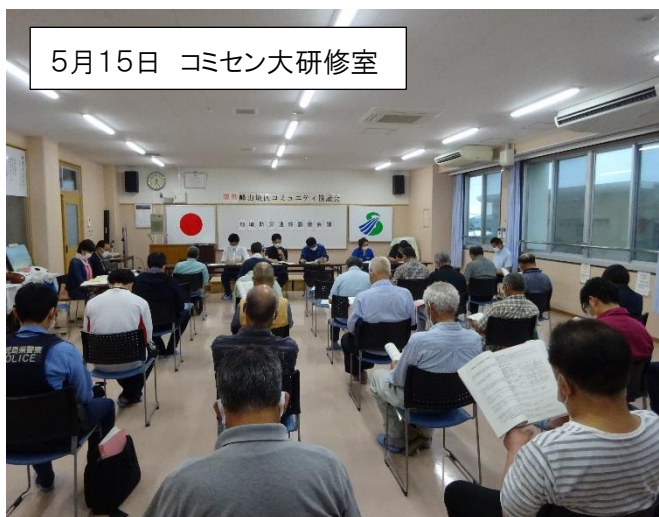
5月15日 コミセン大研修室

※緊急の場合はコミセンで対応しま すが、身の危険を感じる前に上記方法 をとって避難を開始されてください。 ※避難詰所が開設されるまでは、コミ センには詰所員はいません。