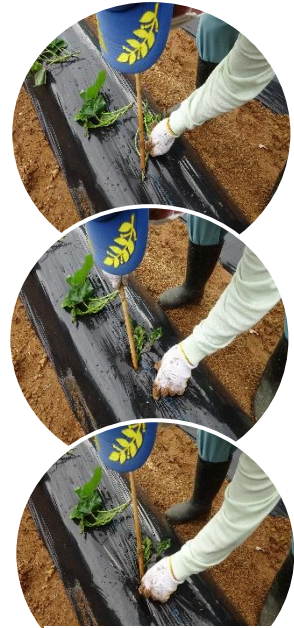
1本1本丁寧に心を込めて

幸い、雨に見舞われることなく、作業を終えることができました。九州電力の方々も応援に駆けつけてくれました。