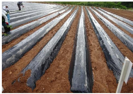
畝の間隔を例年より広くしました