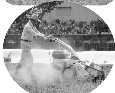
木元会長自ら草刈り