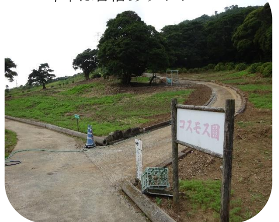
芋、花、山羊も順調に成長中♡