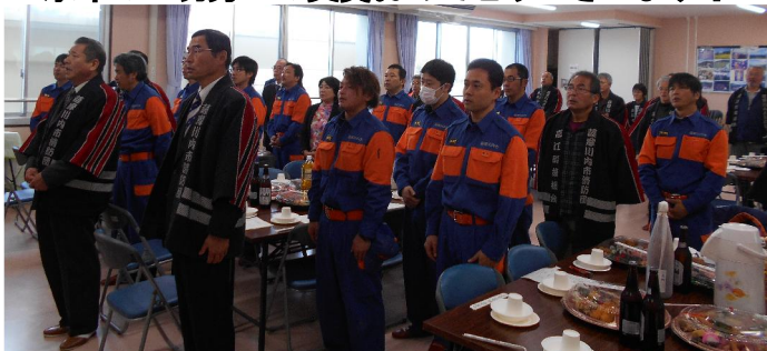
平成30年度 峰山地区コミュニティ協議会消防出初式