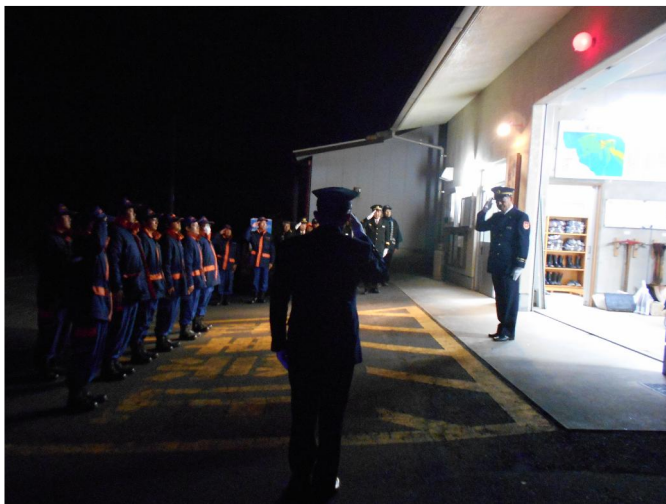
市長への報告風景