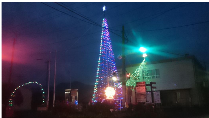
峰山地区の 3 回目のイルミネーション点灯中