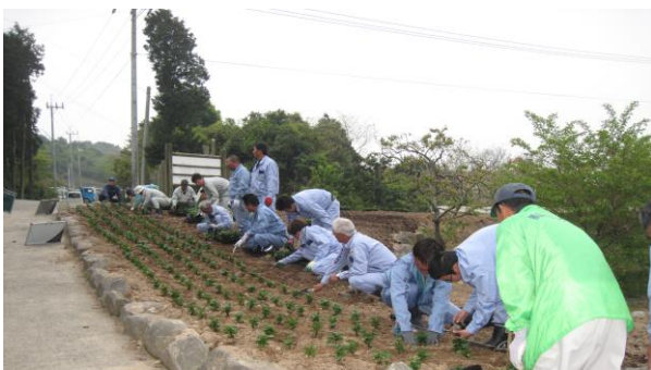
12 日外菌建設工業様と南日本運輸建設様の作業