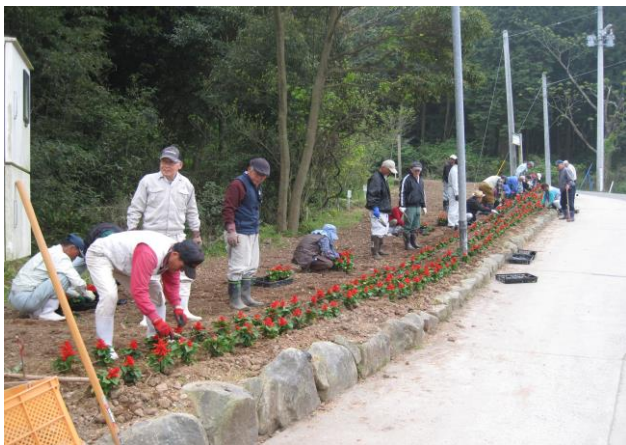
12 日峰山地区の役員・運営委員・地区民の作業

両日とも「レストラン柳山」運営委員などの皆さんが、サツマイモのダンゴ・テンプラ・スティック、漬物などを御提供頂きました。 感謝です。