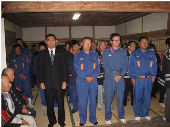
火の神祭り(あっかさ一講)の神事

各自治会女性部などでは、それぞれの地区で「あっかさ一講」が開催され交流がなされました。