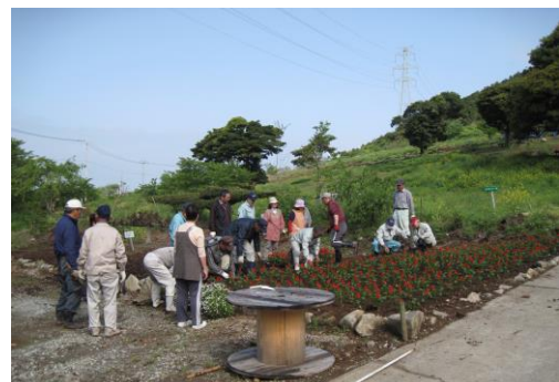
4 月 19 日の 2 回目のサルビア植え