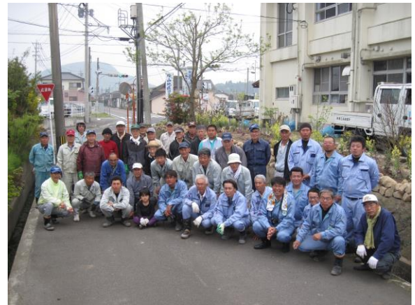
花壇整備終了後の集合写真

4 月 12 日（土）は、柳山アグリランドのサルビア植え終了後に「花いっぱい薩摩川内」の峰山地区シンボル花壇の石積みと除草作業をしました。